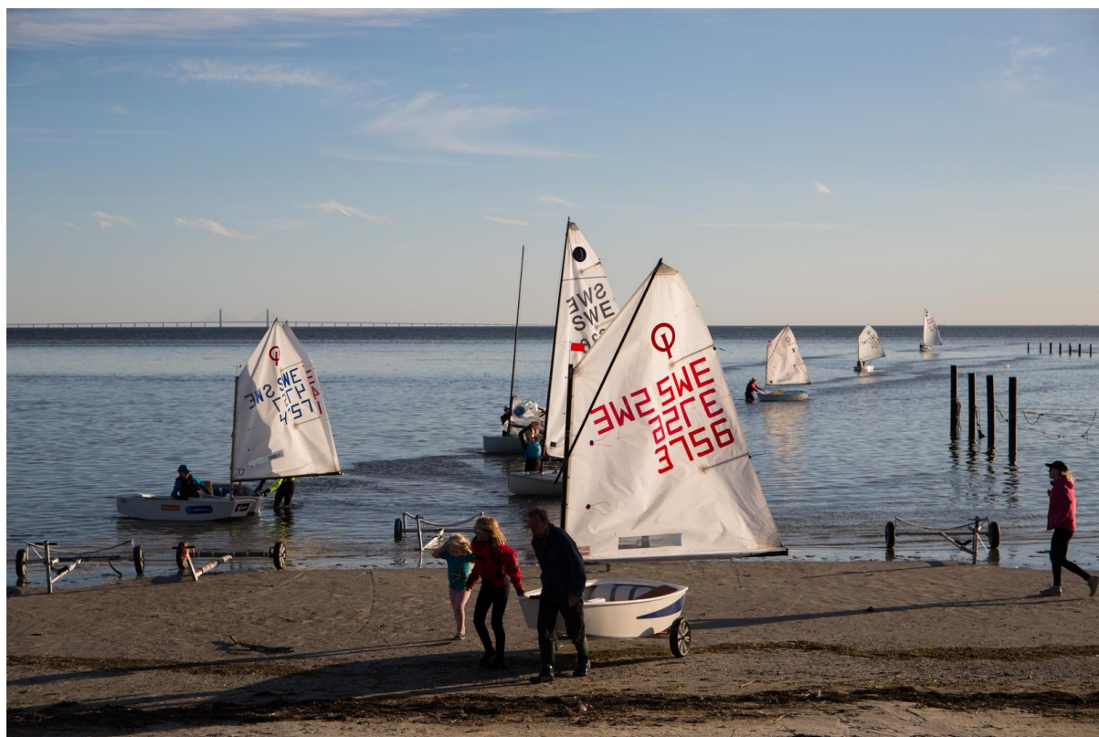
Tisdagscupen en sommarkväll 2022