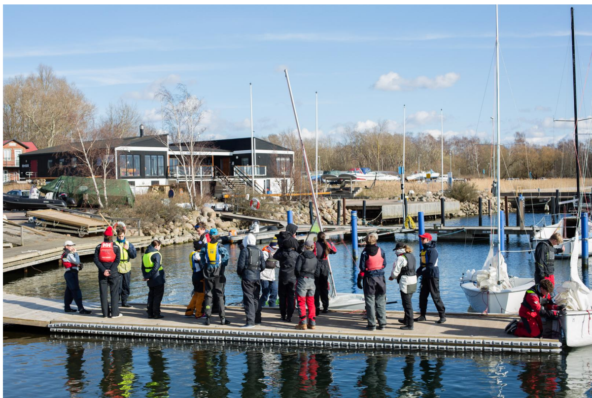
Bild från Tränare grön i Råå i april 2022

BOJK har under året gjort en storsatsning på utbildning som har möjliggjorts dels av ett stipendium från Sparbanksstyrelsen på 15000 kr öronmärkt för utbildning samt en extra satsning på ledarutveckling från Lomma kommunen på 20000 kr.