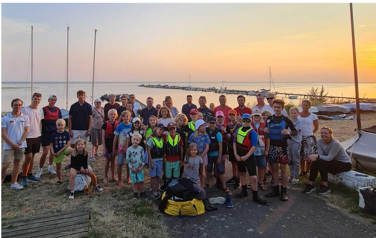
Bild från återträffen för Seglarskolan augusti 2022

Intresset för seglarskolan var stort även 2022, med många både nya och bekanta ansikten bland seglarna! Knappt 100 seglare, nybörjare och fortsättare, deltog under 6 sommarveckor. Efter sista veckan hade vi en välbesökt avslutningsfest med sociala aktiviteter, information till föräldrar om fortsatt segling, och naturligtvis, segling. Vi ville betona kompisskapet och skapa ett bra team för både nya och mer erfarna optimistseglare